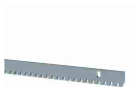
ROA8 listwa zębata metalowa M4, ocynkowana, 30x8 mm, w odcinkach metrowych, w komplecie ze śrubami i tulejami dystansowymi