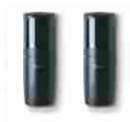
F210B fotokomórki (para) BLUEBUS , nastawna z kątem 210°, zasięg 15 - 30 m