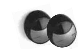
MOFB fotokomórki (para) BLUEBUS , zasięg 15 - 30 m