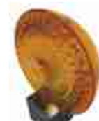
MLB lampa sygnalizacyjna BLUEBUS 12V z wbudowaną anteną